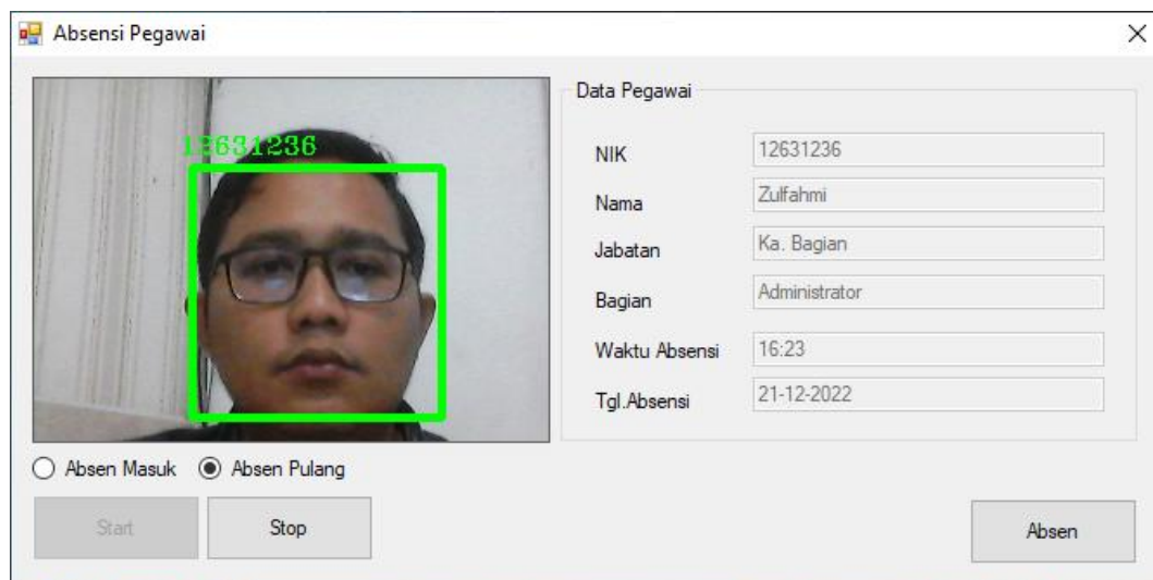
Gambar 6. Tampilan Hasil Pengujian Sistem Kehadiran

Sistem Kehadiran Pegawai Kantor Desa Klambir V dengan Menerapkan dengan Teknik Eigenface Berbasis Face Recognition di uji dengan berbagai cara dan berbagai tahap. Pengujian dilakukan dengan menguji semua menu yang ada disistem. Dan dari pengujian tersebut menghasilkan bahwa sistem tersebut layak dan efektif untuk digunakan pada kantor Desa Klambir V. Hasil dari pengujian tersebut seperti gambar dibawah: