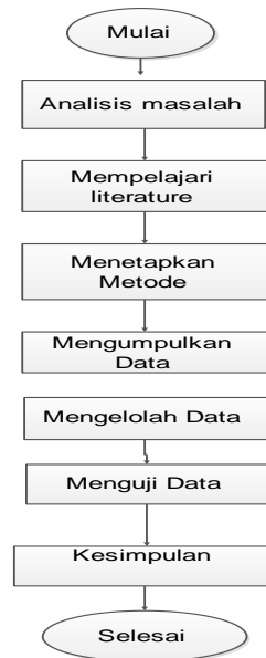
Gambar 1. Rancangan Penelitian

Rancangan penelitian ini akan dijelaskan proses penelitian dan pengumpulan data, selanjutnya data diolah melalui proses perhitungan dan mengikuti langkah-langkah penyelesaian Algoritma C4.5[10]. Selanjutnya hasil perhitungan tersebut akan diaplikasikan menggunakan tools RapidMiner untuk melihat keakuratan hasil yang diperoleh. Rancangan penelitian dapat dilihat pada gambar 1[11].