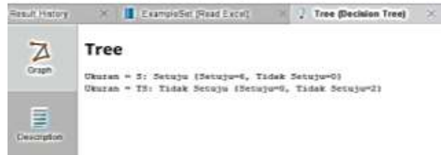
Gambar 7. Rule Model Decision Tree

Pada gambar diatas dapat dilihat bahwa hasil dari pengolahan data secara manual dengan sistem diperoleh hasil yang sama. Dari penjelasan diatas dapat disimpulkan bahwa data yang digunakan adalah data valid dan dapat dibuktikan dengan tools RapidMiner serta dapat menampilkan hasil yang sama dari perhitungan manual maupun dengan tools RapidMiner . Berikut adalah tampilan rule model berupa teks yang ada dalam tools RapidMiner dimana tampilan ini adalah penjelasan dari pohon keputusan yang terbentuk :