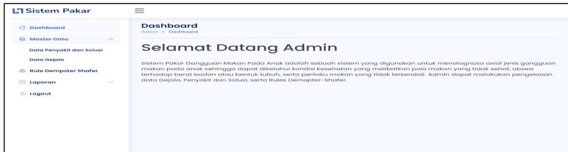
Gambar 2. Tampilan Menu Utama Untuk Administrator

menginput data-data penting seperti gejala, penyakit, serta mengatur prosedur Teori Dempster-Shafer. Antarmuka menu utama pengguna untuk administrator ditampilkan dalam Gambar 2.