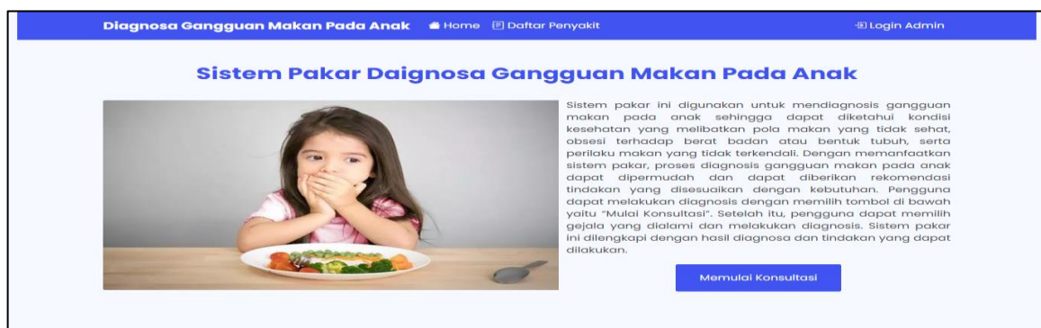
Gambar 3. Fitur Halaman Menu Utama Pengguna

Dalam Gambar 2, antarmuka yang ditampilkan memfasilitasi administrator untuk mengelola data gejala, penyakit dan solusi, serta aturan Dempster-Shafer. Di sini, administrator memiliki kemampuan untuk menambahkan, memodifikasi, dan menghapus data gejala. Fungsi serupa juga tersedia untuk pengelolaan data penyakit dan prosedur Teori Dempster-Shafer, memungkinkan administrator untuk mengatur semua aspek data yang relevan dengan sistem. Untuk pengguna umum, interaksi dengan sistem dimulai dari halaman menu utama. Pada halaman ini, fitur-fitur seperti memulai konsultasi dan melihat daftar penyakit gangguan makan pada anak disediakan untuk memudahkan pengguna dalam mengakses informasi dan layanan yang dibutuhkan. Tampilan antarmuka untuk pengguna pada halaman menu utama dapat dilihat dalam Gambar 3