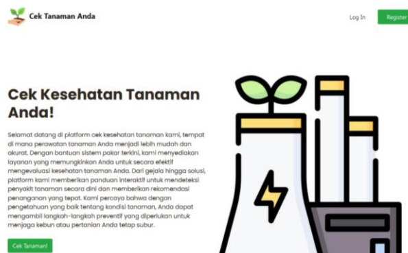
Gambar 2. Halaman utama

Halaman user adalah halaman website yang dimunculkan yang digunakan user untuk melanjutkan ke tahap mengakses pada halaman admin. Halaman utama user dapat dilihat pada gambar 2.